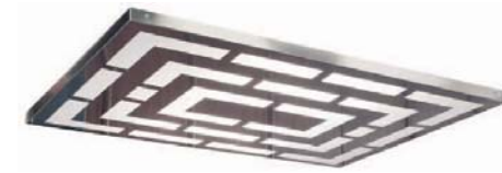
Abatible de chapa en acero inoxidable. Satinado con metacrilato blanco opal