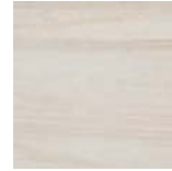
PERGO Madera Marfil