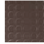
Goma círculos Marrón