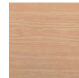
Formica Madera Haya de Saboya