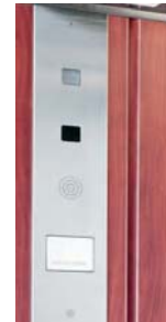
Entrecalles de laminado