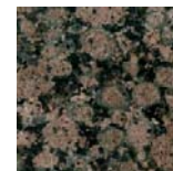
Granito Castaño verdoso